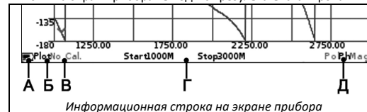
Информационная строка на экране прибора

6.1. На экран прибора выводятся результаты сканирования частотного задания в виде установленных пользователем графиков и диаграмм. Текущие настройки прибора, диапазон сканирования, тип выводимого графика или диаграммы и другая важная для пользователя информация расположена на нижней строке экрана. Рассмотрим эту информационную строку слева направо.