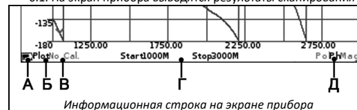
Информационная строка на экране прибора

6.1. На экран прибора выводятся результаты сканирования частотного задания в виде установленных пользователем графиков и диаграмм. Текущие настройки прибора, диапазон сканирования, тип выводимого графика или диаграммы и другая важная для пользователя информация расположена на нижней строке экрана. Рассмотрим эту информационную строку слева направо.